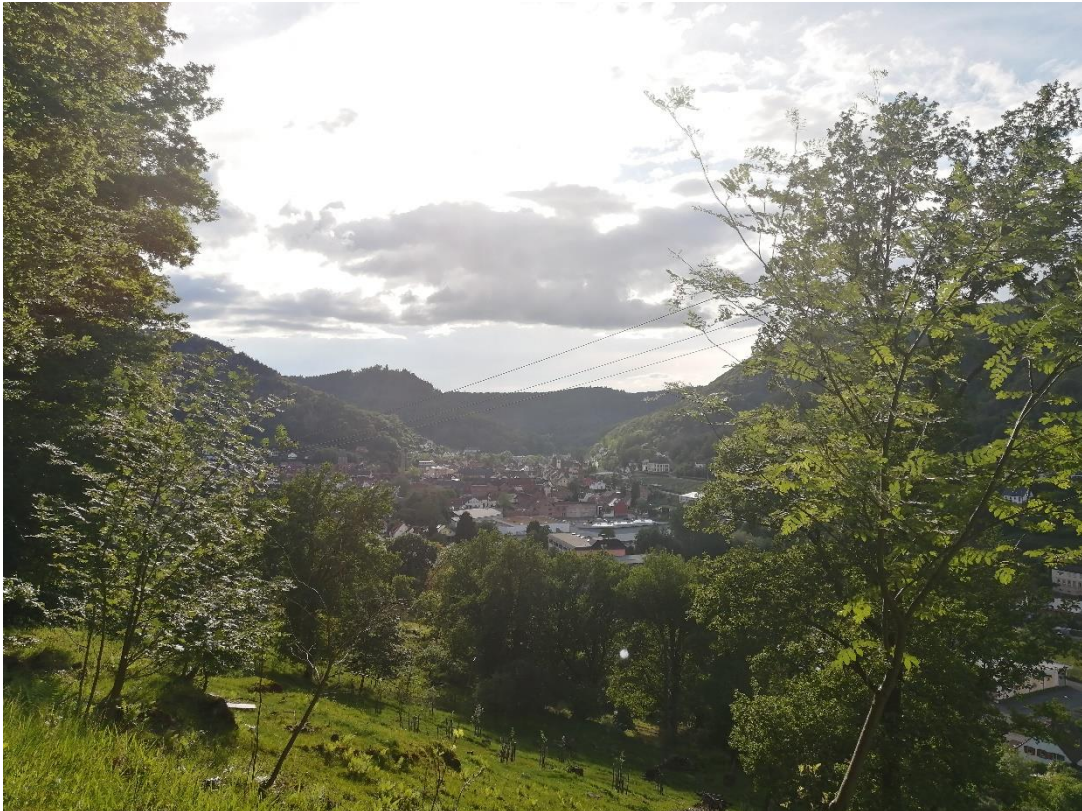
Abbildung 1: Blick über Lambrecht

Biosphärenreservat Pfälzerwald-Nordvogesen Geschäftsstelle Pfälzerwald Franz-Hartmann-Straße 9 67466 Lambrecht (Pfalz) Betreut durch Antje van Look