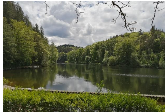
Abbildung 13: Besuch am Eiswoog

Bei einem Treffen am Erlebnispfad Eiswoog begleitete ich unsere Direktorin Friedericke Weber, Arno Weiß und Antje van Look. Auch bei diesem Treffen, bei dem es um die Umsetzung eines barrierefreien Erlebnispfades ging, schrieb ich die Verbesserungsvorschläge und Änderungsbeschlüsse auf, um sie später in das bisherige Konzept einzupflegen.