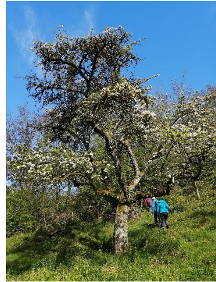
Abbildung 4: Permakultur auf der Streuobstwiese

Die beiden Vorträge, „Fachlicher und praktischer Überblick zum Thema Gebäudebegrünung“ und „Gärten für die Artenvielfalt: Kommunale Grünflächen – ökologisch schön gepflegt“ fanden im Gebäude der Pfalzakademie in Lambrecht statt, weshalb ich bei den Vorbereitungen half. Dazu gehörte beispielsweise das Aufbauen und Einrichten des Laptops und des Beamers, das Auslegen unserer Flyer und der Aufbau von Rollups. Ebenso half ich nach der Veranstaltung auch beim Abbau. Abgesehen von den Vorträgen, nahm ich außerdem noch an der Veranstaltung „Natürlich gestalten: Permakultur für blühende Gärten und Streuobstwiesen“ teil.