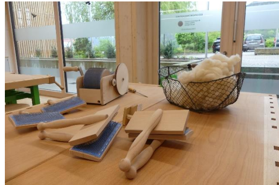
Abbildung 8: Materialien für den Workshop