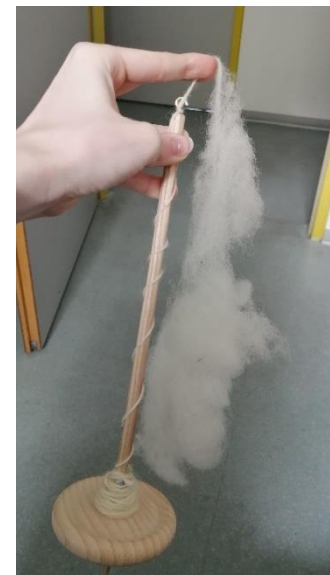
Abbildung 6: Spinnen mit der Handspindel

Auch ich konnte viel aus diesen Workshops mitnehmen, da ich neben der pädagogischen Arbeit auch selbst im Voraus lernen musste, wie Kardieren und Spinnen mit der Handspindel überhaupt funktioniert, um es den Kindern später zeigen und erklären zu können.