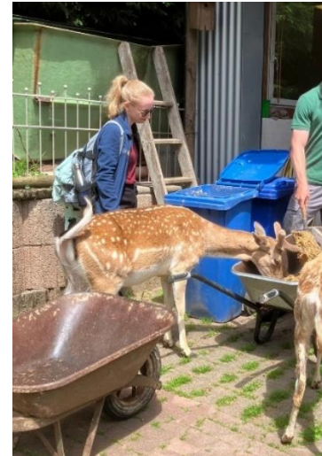
Abbildung 12: Zu Besuch bei der Damtierhaltung Clausen

Dort führte uns der Actionbound zu dem Gelände der Damtierhaltung Clausen, wo wir bereits zu einer Führung erwartet wurden. Der Besuch bei der Damtierhaltung eröffnete uns die Möglichkeit, den Luchs auch aus einer landwirtschaftlichen Perspektive zu betrachten. Dabei erfuhren wir, dass ein Luchs bereits mehrere Tiere aus ihrem Bestand getötet hatte und daraufhin ein spezieller Schutzzaun angebracht wurde. Doch auch der Schutzzaun hat für die Tierhalter Vor- und Nachteile und es wurde deutlich, dass der Umgang mit dem Thema Luchs, den Maßnahmen und gegebenenfalls den Entschädigungen aus landwirtschaftlicher Sicht noch nicht optimal ist. Auch das Damwild und das Gelände durften wir uns ansehen, bevor es auf einem etwas anderen Weg durch den Wald wieder zurück zu unserem Ausgangspunkt ging. Zum Abschluss wurden nochmal die Meinungen und Anregungen zum Actionbound ausgetauscht.