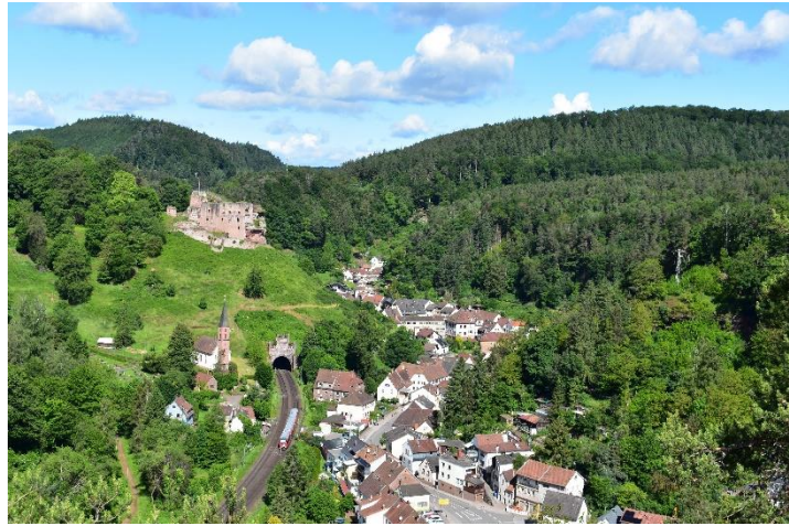
Abbildung 9: Blick auf Frankenstein und Beweidungsflächen

Außerdem bekamen wir von dem dortigen Bürgermeister einige weitere ehemalige Beweidungsflächen gezeigt, die ich auch fotografieren sollte. Zurück im Büro laminierte ich mehrere Schilder und einige dieser ausgedruckten Bilder, die wir als Beispiele bei der Veranstaltung zeigen wollten. Außerdem half ich bei weiteren kleineren Aufgaben, wie dem Packen des Autos.