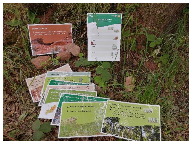
Abbildung 7: Von mir gestaltete Materialien der Rallye

Mein vermutlich größtes Projekt während meiner Praktikumszeit war die Biosphären-Rallye. Das grobe Konzept sowie die Themen für die Stationen erarbeiteten Anne Laux, Micaela Mayer und ich gemeinsam. Anschließend war es meine Aufgabe, den Laufzettel, die Fragen und die dazugehörigen Stationskarten zu erstellen und gestalten, womit ich viel Zeit verbrachte. Unter anderem erstellte ich dazu selbst ein paar kleine Bilder, die auch zukünftig zur Gestaltung von Materialien genutzt werden können.